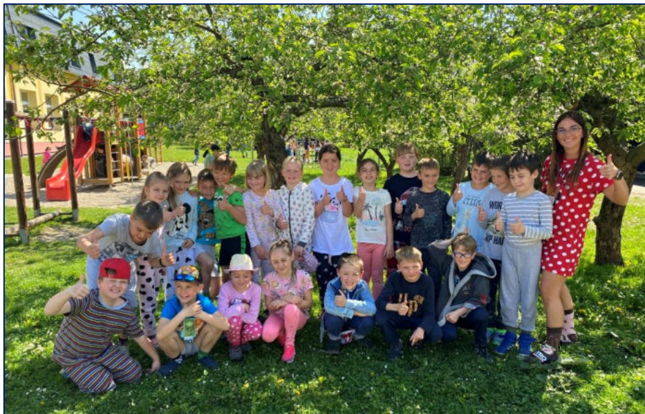
Pyžamo – Dedoles den – pro žáky 2. třídy