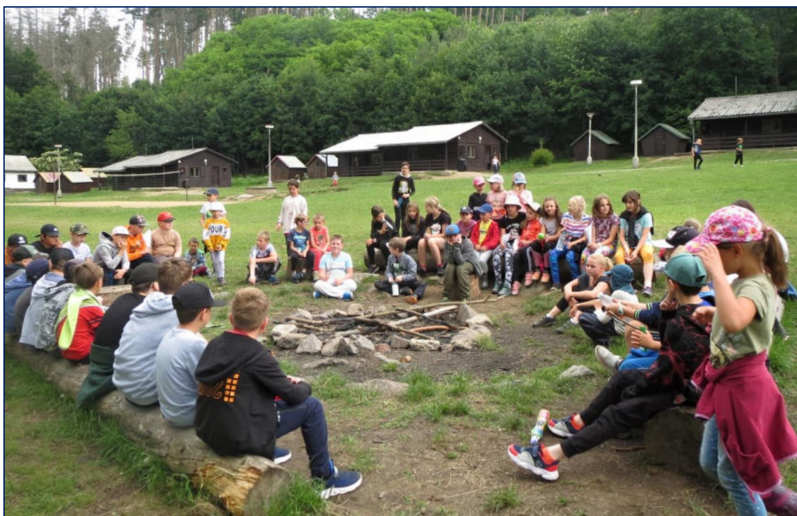
Škola v přírodě – společné zážitky hrají při prevenci důležitou roli

V tomto školním roce bylo uděleno celkem 114 pochval třídního učitele. Na konci druhého pololetí dostalo 7 děvčat pochvalu ředitelky školy za úspěšnou reprezentaci školy na okresní i krajské soutěži mladých zdravotníků.