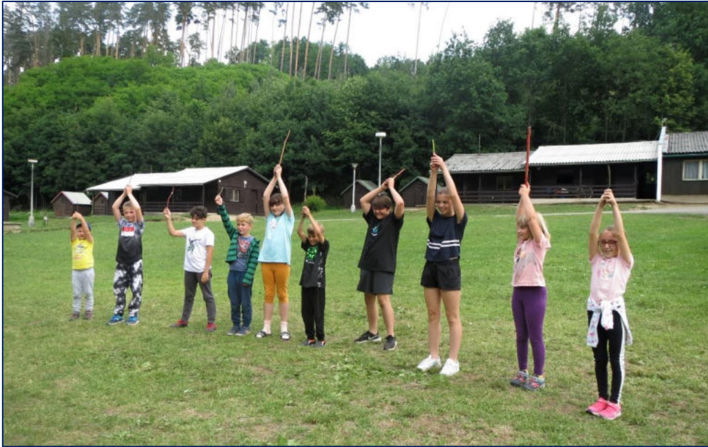
Společné čarování na škole v přírodě

VÝROČNÍ ZPRÁVA BYLA SCHVÁLENA ŠKOLSKOU RADOU DNE 25. 10. 2022