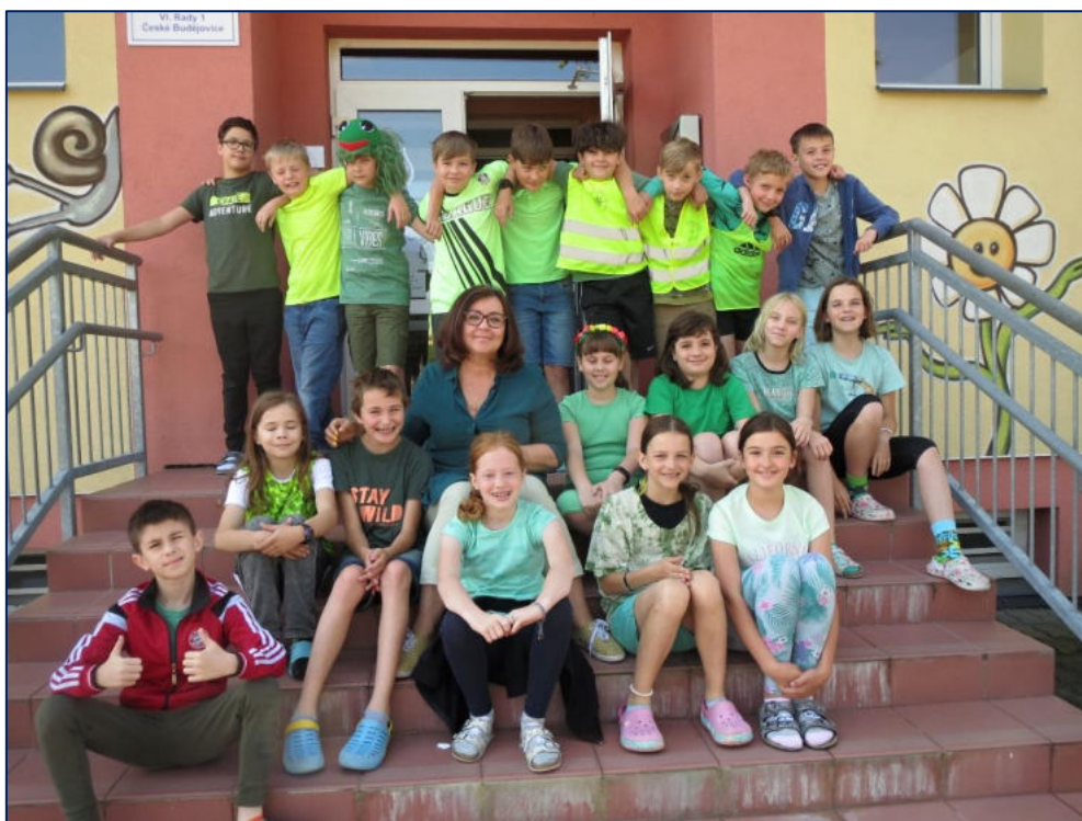
Třídní den Jedeme na zelenou ve 4. třídě

Ve všech předmětech jsme podněcovali rozvoj zdravého sebevědomí, ve výchovách měl každý žák možnost uplatnit svůj talent. Žáci byli také vedeni k tomu, aby našli odvahu k překonávání překážek (v hodinách tělesné výchovy, v rámci aktivit školní družiny, při dalších akcích).