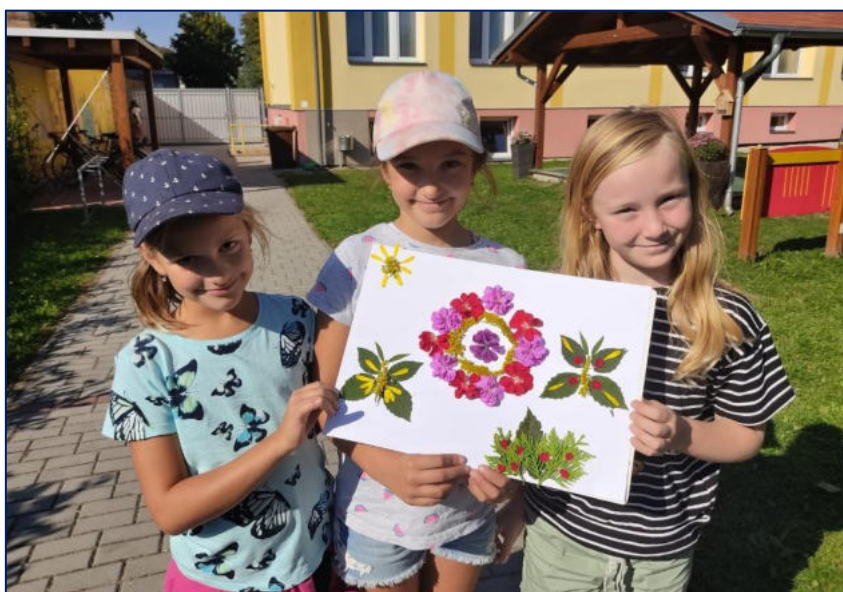
Tvoření z přírodnin

Ve školním roce 2021/2022 byla otevřena 3 oddělení pod vedením 3 vychovatelek, v době oběda vypomáhaly ve ŠD rovněž učitelky ZŠ.