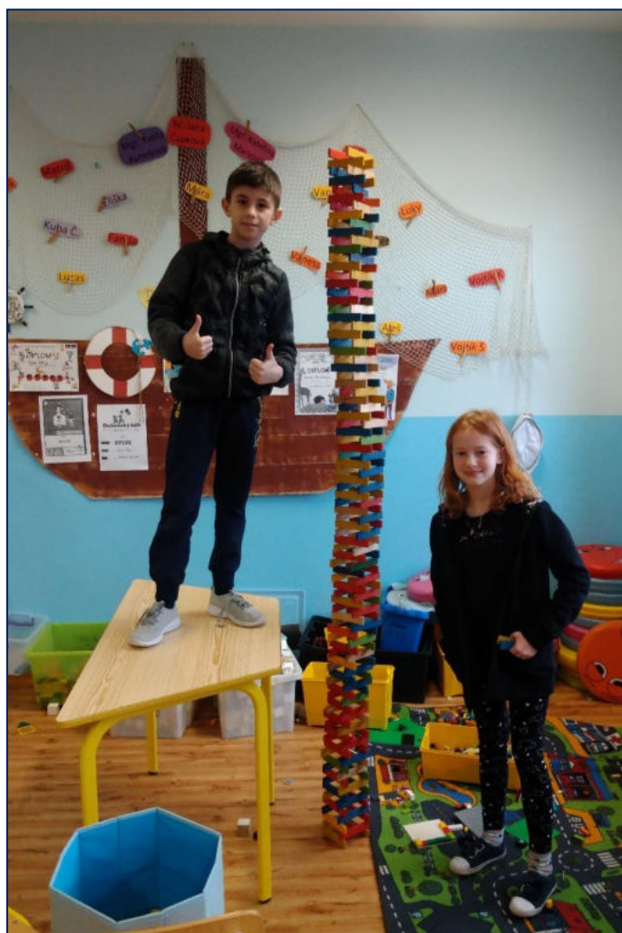
Stavitelé ve školní družině

Hygienické minimum pro pracovníky školních jídelen – tohoto školení se zúčastnily ještě další dvě zaměstnankyně ze školní jídelny.