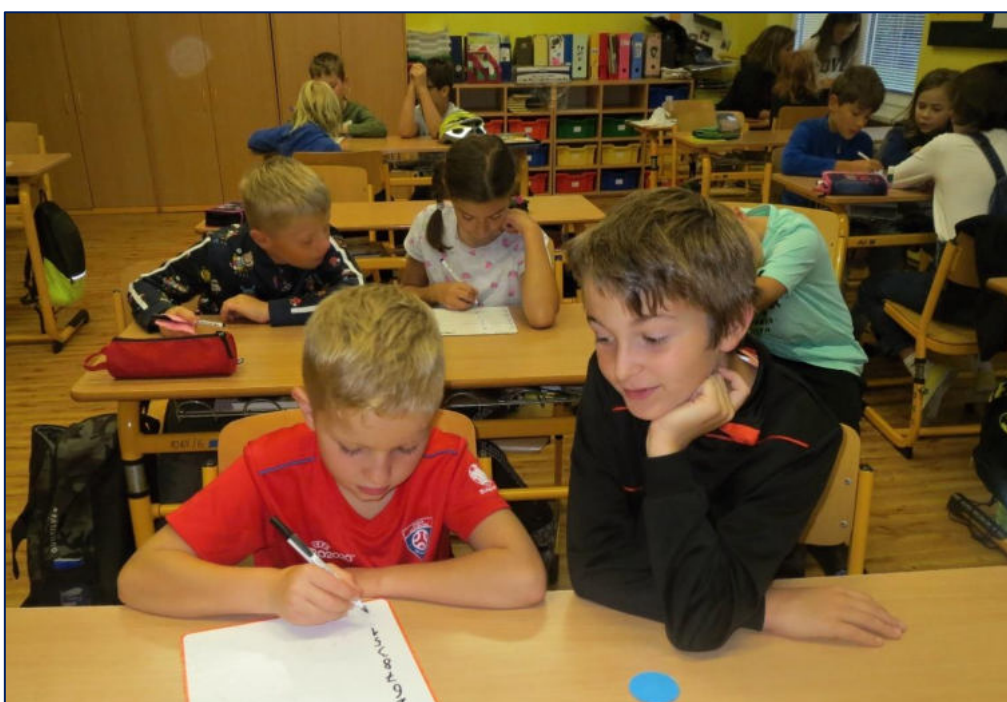
Společná práce ve třídě v září 2021 – naštěstí bez roušek. Nosit ochranný prostředek bylo povinné pouze ve společných prostorách školy.

Ve školním roce 2021/2022 navštěvovalo ZŠ přes 110 žáků 1. – 5. ročníku. Další dva žáci plnili povinnou školní docházku v zahraničí. Kapacita školy byla naplněna cca na 90 %. Celkově zde bylo šest tříd, z toho byly dvě 3. třídy, v ostatních ročnících (1., 2., 4., 5.) po jedné třídě.