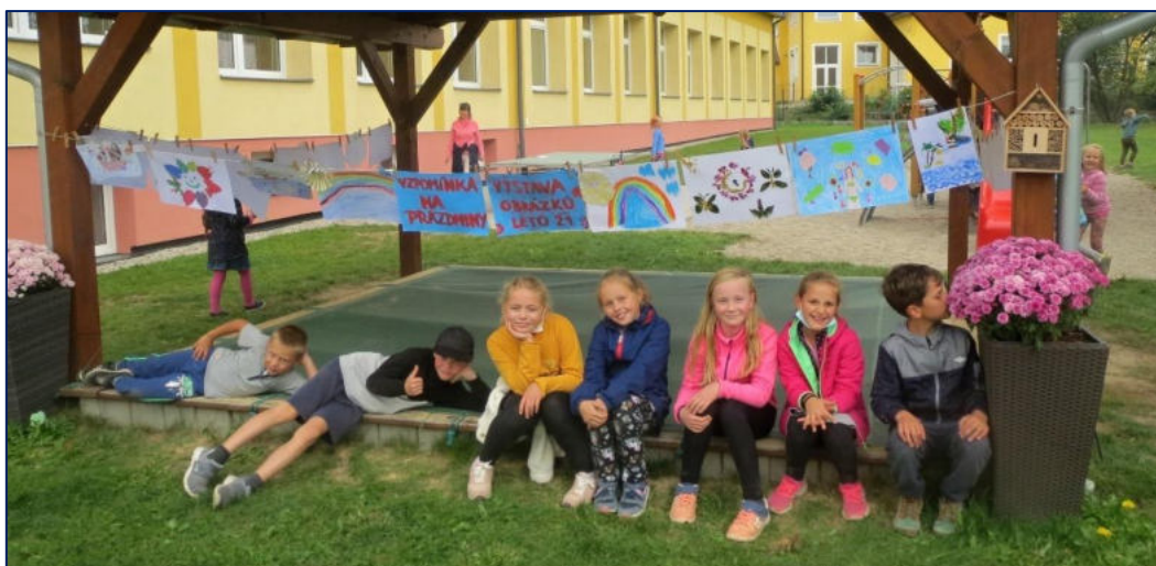
Obrázkové vzpomínání na prázdniny 2021

Po celý školní rok zasílalo MŠMT školám velké množství informačních dopisů a metodických pokynů, které souvisely jak se zvládáním epidemie koronaviru, tak s ozbrojeným konfliktem na Ukrajině. Školy se musely potýkat s novými předpisy, nařízeními a zákony. To vše ztěžovalo obecně běžný chod našich škol.