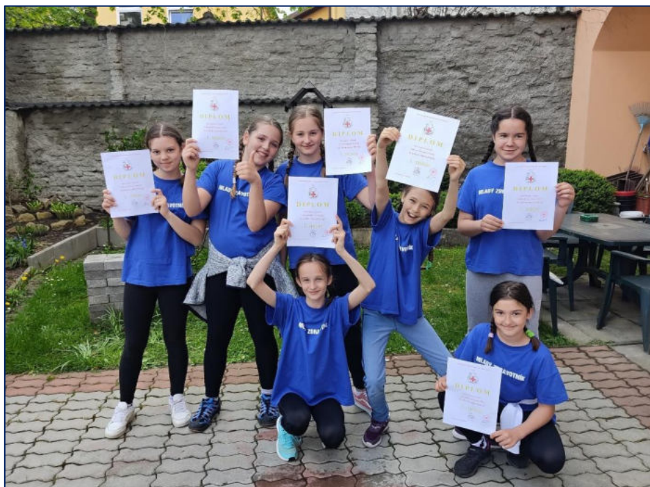
Radost z vítězství

Škola udržitelného rozvoje – soutěž ekologické výchovy; za realizaci množství ekologických akcí, zájem o ekologii, životní prostředí a udržitelný rozvoj propůjčil Základní škole a Mateřské škole, VI. Rady 1, České Budějovice na léta 2022 – 2024 Jihočeský kraj ve spolupráci s Klubem ekologické výchovy a VŠERS titul Škola udržitelného rozvoje Jihočeského kraje 2. stupně