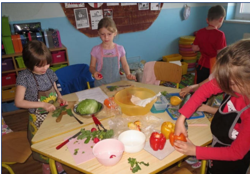
Příprava zeleninového salátu – 1. třída

V závěru dne proběhlo v každé třídě shrnutí projektu.