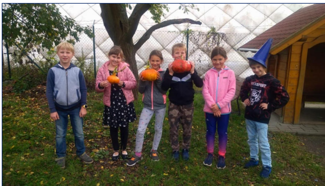
Dýňobraní na školní zahradě

Do MŠ Kališnická bylo přijato 1 dítě z Ukrajiny.