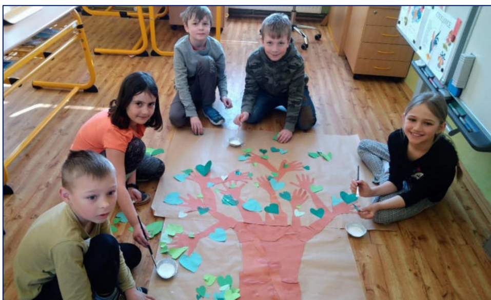
Skupinová práce – 3. třída