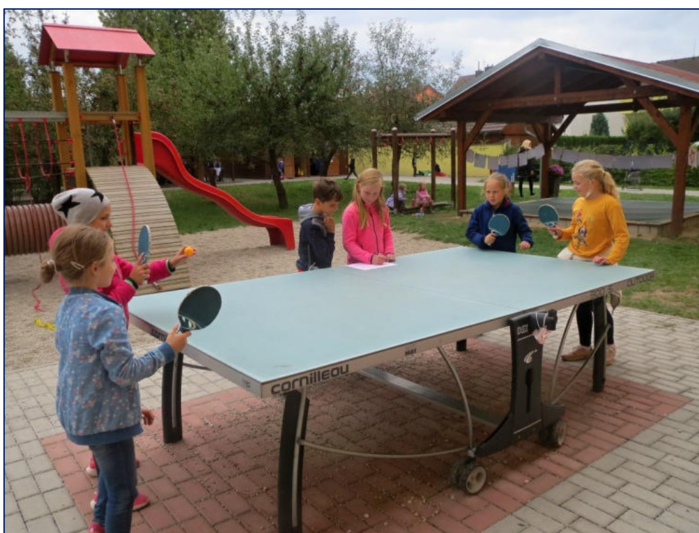
Chvilka na školní zahradě

Velkou výhodou školy je přilehlá zahrada, kterou žáci za příznivého počasí denně využívají (pohybová přestávka, činnosti školní družiny).