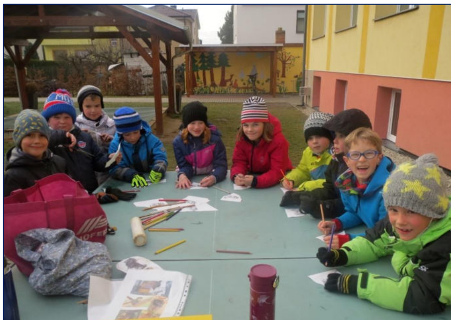
Ideální výuka venku bez roušek

Od 1. 9. 2021 do 11. 3. 2022 byli žáci i zaměstnanci školy či třetí osoby nacházející se v škole povinni nosit ochranný prostředek (roušky, respirátory) ve společných prostorách školy. V případě, kdy byli žáci usazeni ve třídě, ochranný prostředek mít nemuseli.