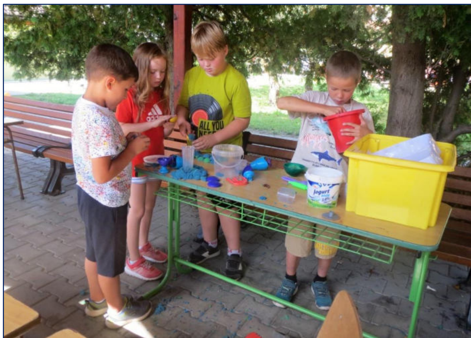
Tvoření z barevného písku

Zahradničení na školní zahradě – péče o rostliny, dřeviny, bylinkový záhon