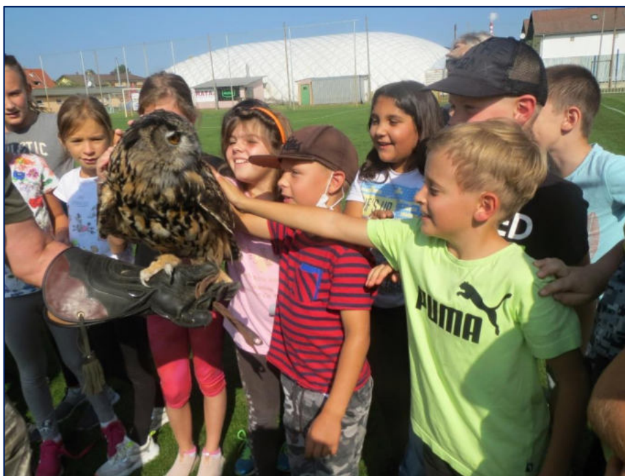
Naučný program – Ze života dravců