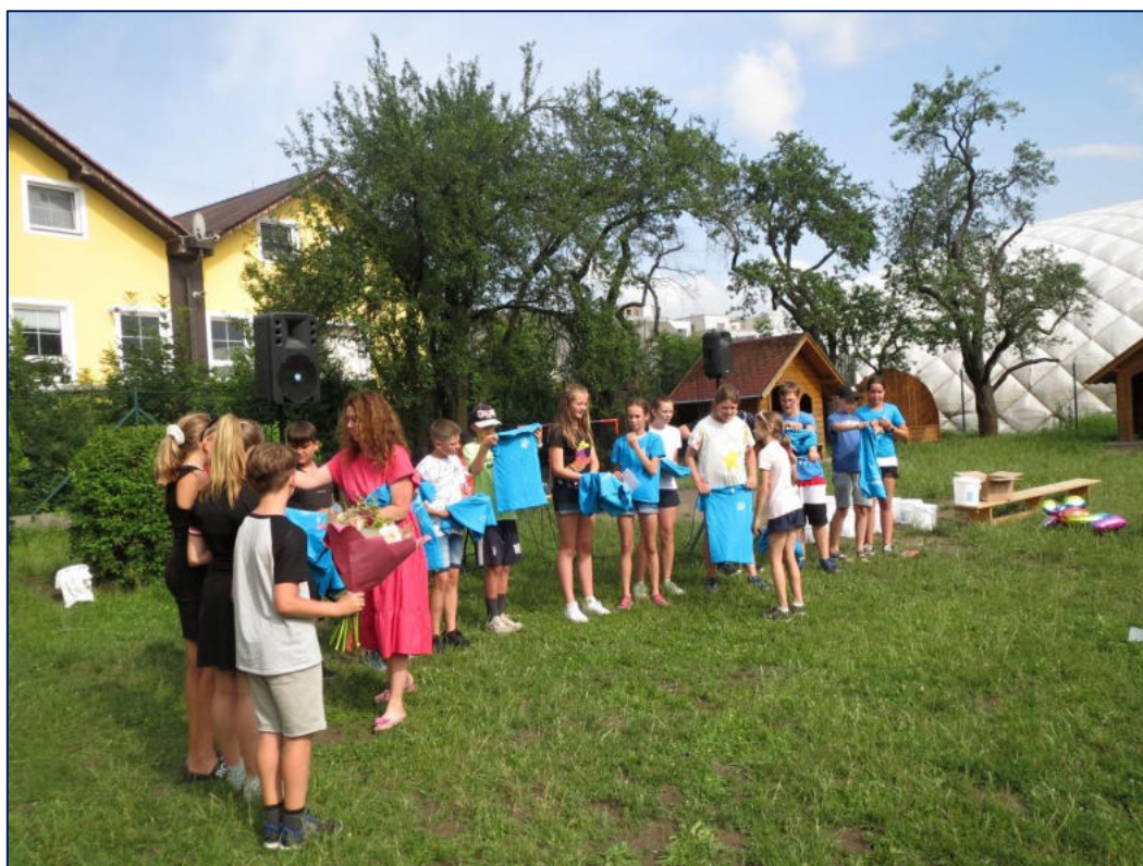
Rozloučení se žáky 5. ročníku na zahradní slavnosti

Soukromá základní a mateřská škola Viva Bambini – 1 žák