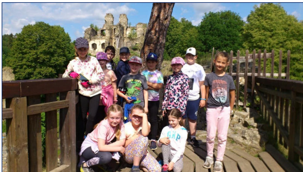
Z výletu na Dívčí kámen