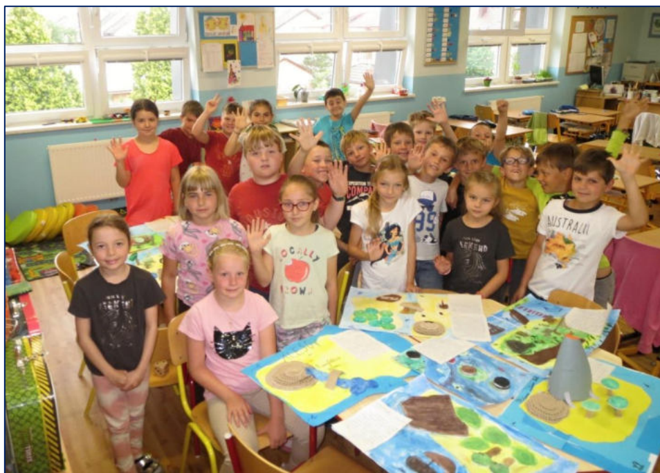
Můj ostrov – projektový den ve 2. třídě

Žákům se speciálními vzdělávacími potřebami, ale i dalším žákům školy, poskytovali pedagogové podporu v podobě doučování (celkově cca 260 hodin doučování za školní rok). Žáci byli doučováni zejména v hlavních předmětech – v českém jazyce, matematice a v anglickém jazyce. U cizinců bylo dbáno na to, aby zvládli základy jazyka a dorozuměli se v běžných denních situacích.