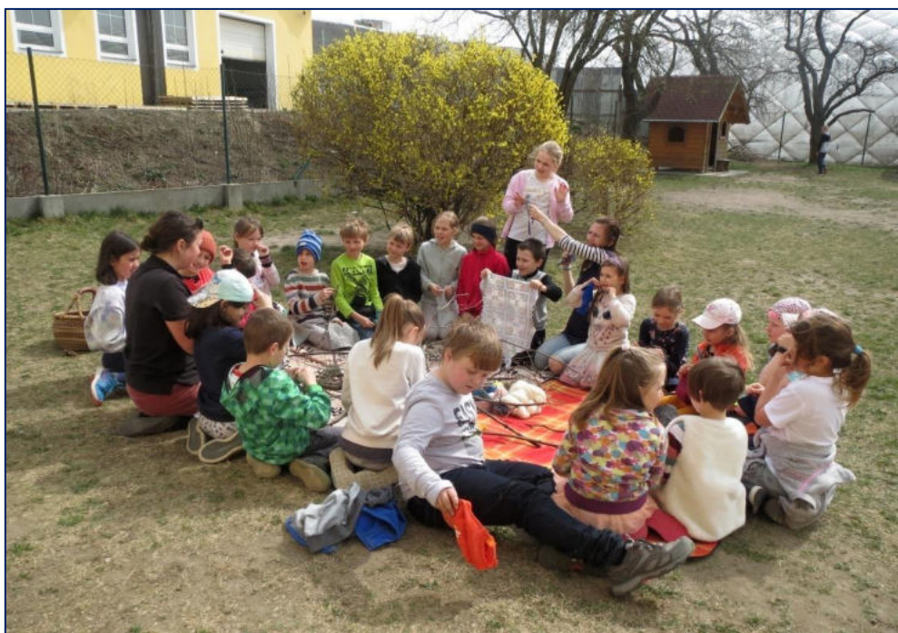
Hravé odpoledne s Cassiopeiou

Hravá odpoledne s Cassiopeiou v rámci jednotlivých oddělení – vzdělávací a pohybové hry s přírodovědnou tematikou