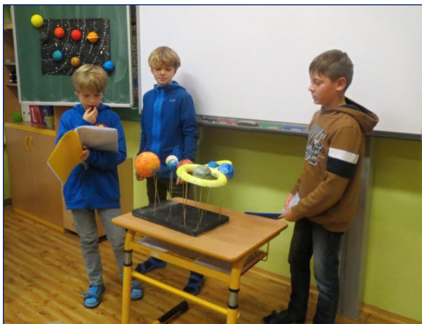
Vesmír – prezentace žáků 5. ročníku

V každé třídě se pravidelně konal diskusní kruh, jehož prostřednictvím byli žáci vedeni k umění všestranné, otevřené komunikace. Žáci byli rovněž podněcováni k tomu, aby se nebáli požádat o radu, společně se učili řešit případné konflikty, učili se pracovat s chybou.