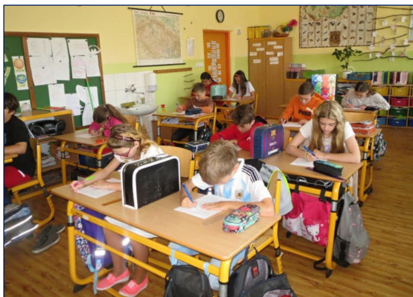
Soustředění při samostatné práci ve třídě