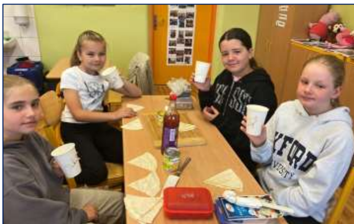
Matematika – netradiční výuka zlomků