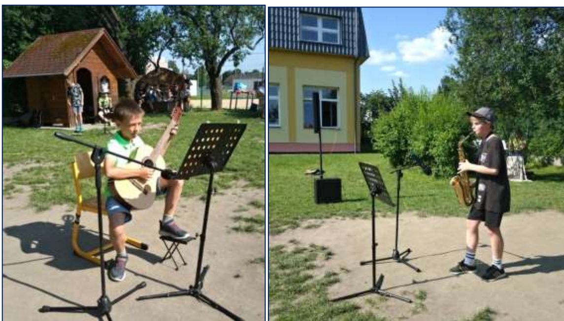
Z vystoupení žáků na zahradní slavnosti