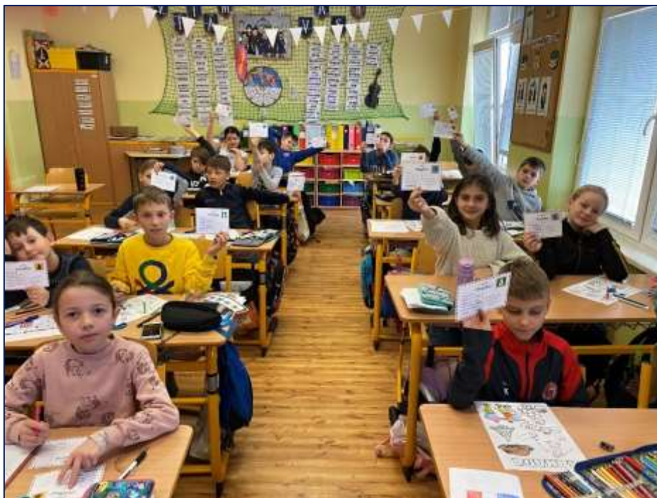
Při práci na projektu Vánoční cesta – 4. třída