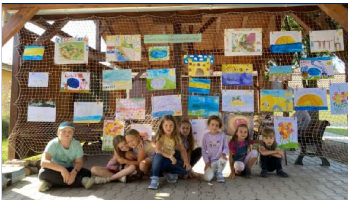
Tvoření na školní zahradě

Budova základní školy byla poprvé pro žáky otevřena 1. září 1958. Do roku 2008 byla ZŠ přízemní budova. V roce 2008 bylo přistavěno 1. patro a zrekonstruováno přízemí a suterén budovy. Byl vybudován výtah, což přineslo možnost integrovat do školy žáky se zdravotním handicapem. Velkou výhodou školy je přilehlá zahrada, kterou žáci za příznivého počasí denně využívají (pohybová přestávka, činnosti školní družiny).