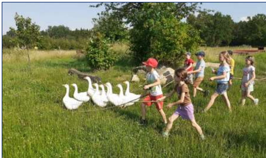
Společné zážitky na škole v přírodě

a OSPOD, ředitelka školy absolvovala webinář Jak na výchovu a vzdělání dítěte s náročným chováním, dále webinář Začlenění dítěte s PAS do kolektivu.