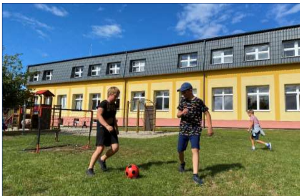
Sportování na školní zahradě

V MŠ jsou 3 třídy s celodenním provozem, kapacita je 84 dětí. Ve školním roce 2023/2024 navštěvovalo MŠ 72 dětí. Sloučení ZŠ a MŠ do jedné organizace umožnilo užší spolupráci mezi oběma typy škol.