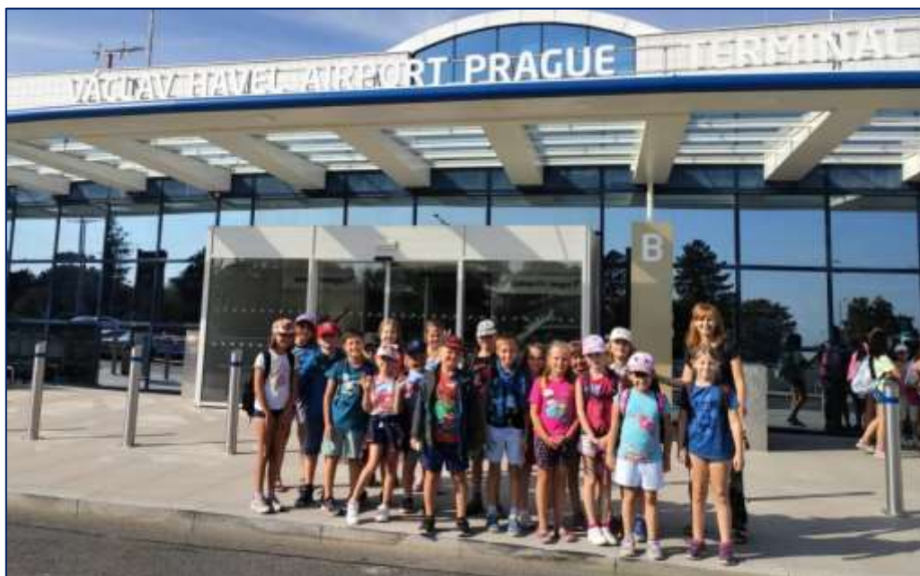
Na Letišti Václava Havla