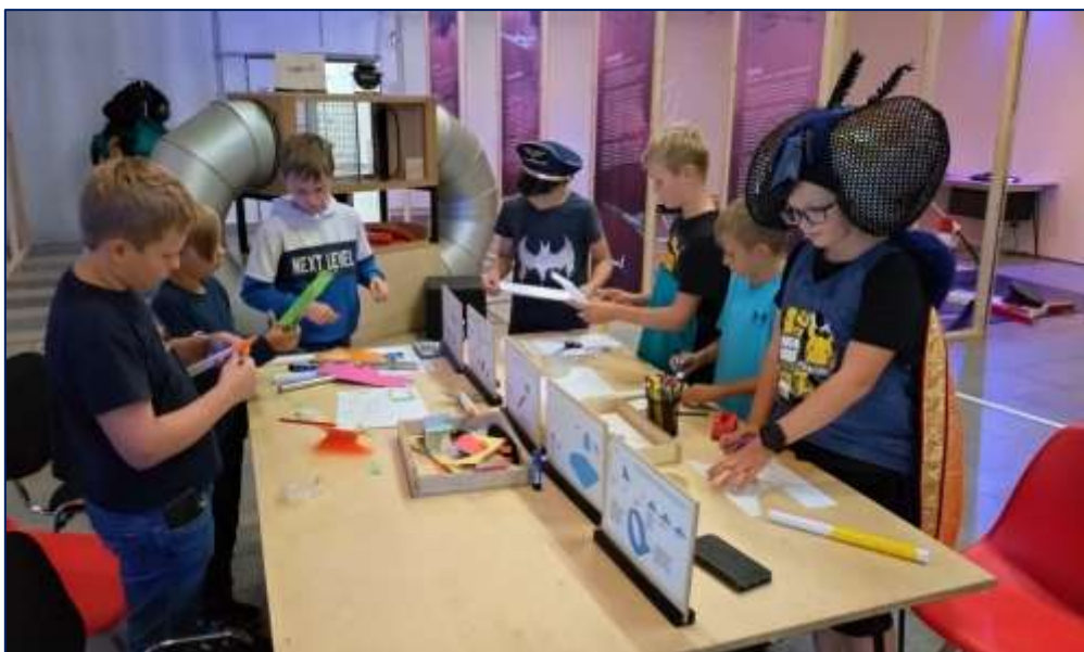
Na interaktivní výstavě Letme vysoko