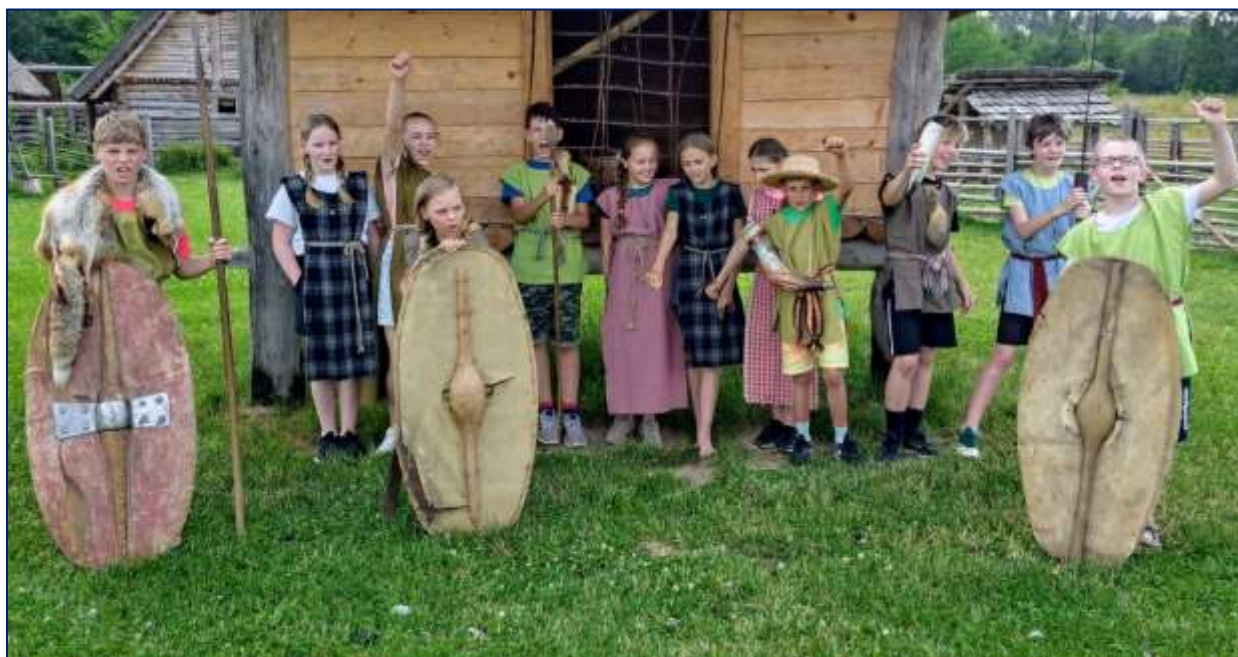
Pátáci na škole v přírodě

ZŠ Dobrá Voda u Českých Budějovic – 1 žák