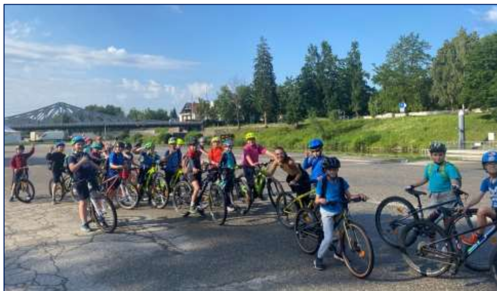
Žáci 4. třídy na cyklovýletě

Třídní učitelé během roku udělili celkem 6 napomenutí, ve většině případů se jednalo o poničení školního majetku. Další přestupky řešili pouze ústně, domluvou. Pochval třídního učitele bylo uděleno celkem 133 za celý školní rok.