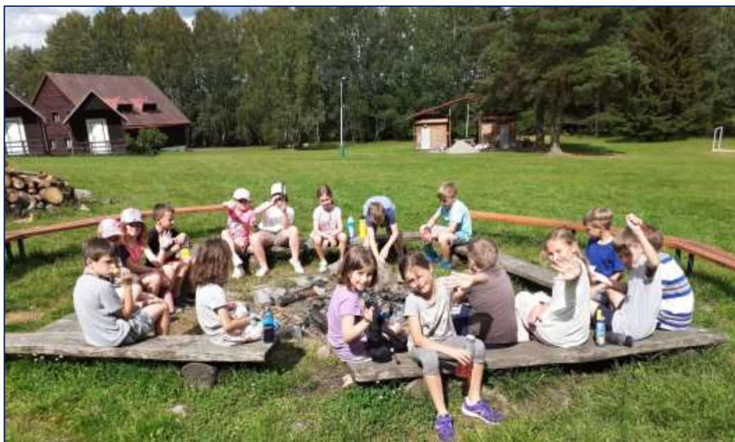
Na škole v přírodě

Celkově se v průběhu roku uskutečnila čtyři setkání. Tři setkání proběhla v 1. třídě, čtvrté se uskutečnilo na zahradě ZŠ – všechny děti zde měly společnou hodinu tělesné výchovy. Předškoláci se v průběhu jednotlivých setkání zapojovali do různých činností, prezentovali své vědomosti, osvojovali si některé elementární poznatky a dovednosti. Žáci první třídy se ujali role pomocníka a rádce – v průběhu setkání předškolákům pomáhali a radili, pokud bylo třeba.