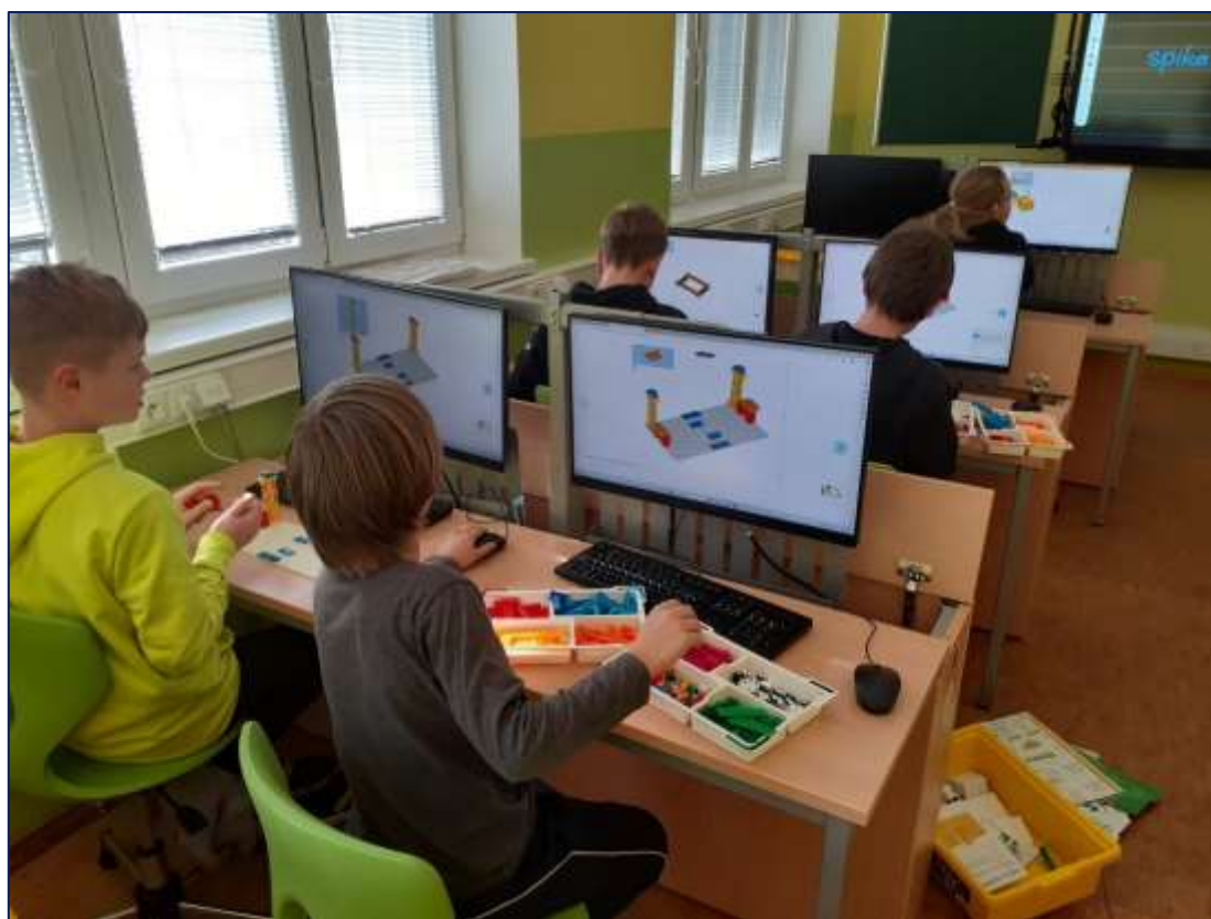
V nově vybavené multimediální učebně – LEGO Education

Celkové náklady na tuto akci činily 2 209 631,- Kč, z toho IT vybavení (7 interaktivních panelů, 21 mini PC, příslušenství) bylo v částce 1 791 042,- Kč včetně DPH a nábytek do multimediální učebny byl za 418 589 Kč včetně DPH. Vybavení stávající počítačové učebny bylo již velmi zastaralé, záměrem bylo proto vybudovat novou multimediální učebnu, kde by bylo možno vyučovat vedle informatiky i jiné předměty (např. angličtinu, přírodovědu, vlastivědu...). Nyní jsou v multimediální učebně stoly s elektrickým výsuvným mechanismem – počítače jsou skryté v prostoru stolu a pokud nejsou při výuce třeba, je možno jednoduše monitory včetně klávesnice zasunout do úložného prostoru a žáci mají k dispozici celou plochu stolu. Prostor je tak více variabilní.