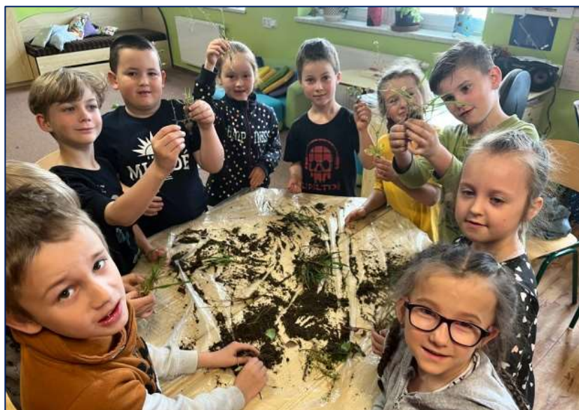
Den Země – 1. třída

omezení automobilové dopravy ve městě. Uvědomovali si, jaké mají možnosti při přesunech po městě a dva týdny si zaznamenávali, jakým způsobem se do školy dopravili.