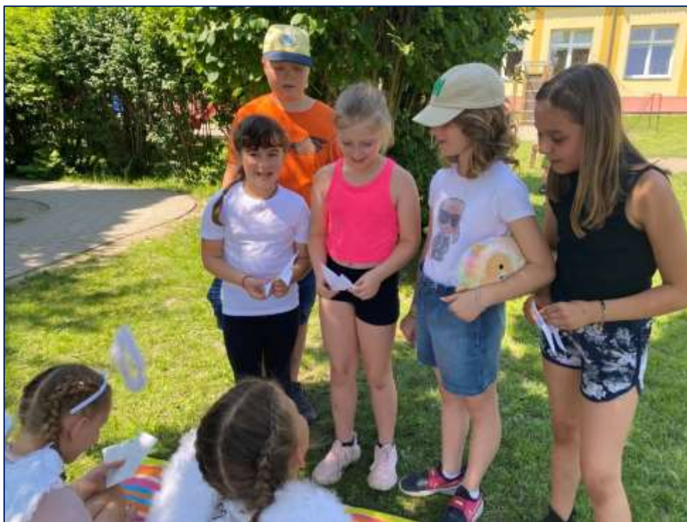
V rámci zahradní slavnosti připravili žáci 5. tříd pro své mladší spolužáky nejrůznější soutěže

1. stupeň podpory poskytovala škola i bez konzultace a rozhodnutí pedagogicko-psychologické poradny (PPP) nebo speciálně pedagogického centra (SPC). Jednalo se o žáky, u kterých se projevovaly různé obtíže ve vzdělávání. Dále byla podpora poskytována žákům-cizincům, byla prohlubována jejich dovednost dorozumět se zejména v běžných denních situacích. Poskytování podpůrných opatření škola průběžně vyhodnocovala, s tímto vyhodnocením byli vždy seznámeni i zákonní zástupci žáka. Některým žákům školy poskytovali pedagogové podporu v podobě doučování.