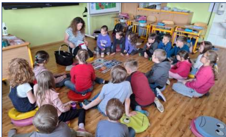
Den Země – 2. třída