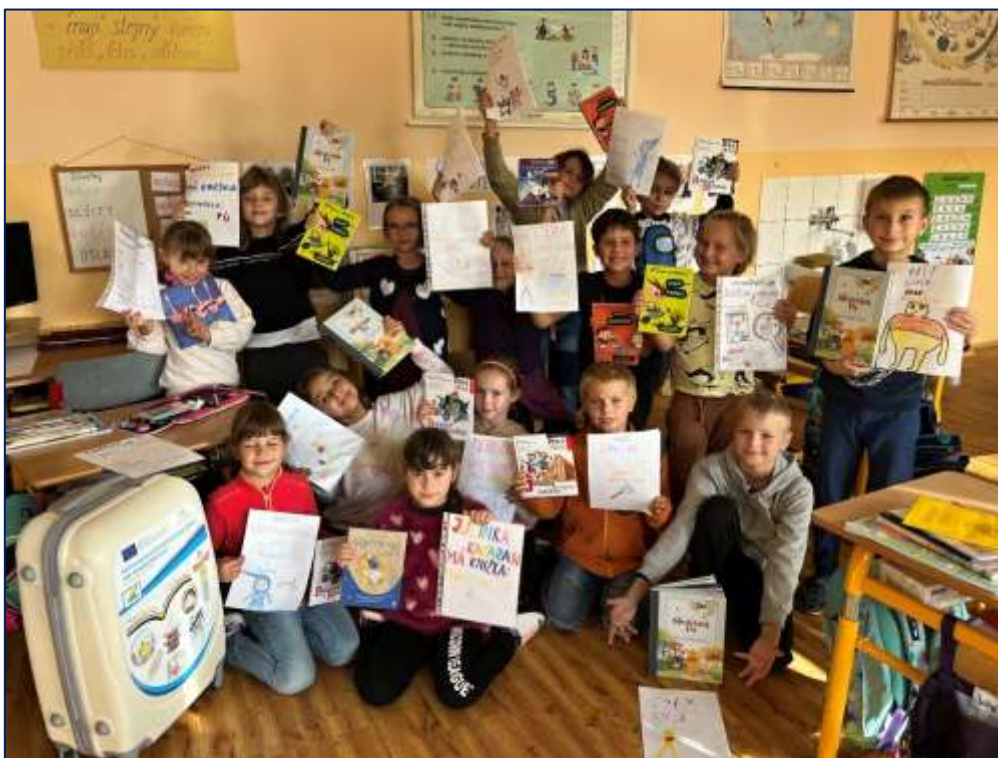
Kufř plný knih – trénink čtenářských dovedností se žáky 3. ročníku

V ZŠ i MŠ jsou ustanoveny školnice, obě vykonávají běžné domovnícké práce a zodpovídají za úklid. Úklid zajišťuje dále ještě jedna uklízečka, která pracuje zčásti v ZŠ a zčásti v MŠ. S drobnými opravami ve škole vypomáhá údržbář, který je zaměstnáván na dohodu. Odbornou pomoc v oblasti ICT zajišťuje občas rovněž jeden pracovník na dohodu.