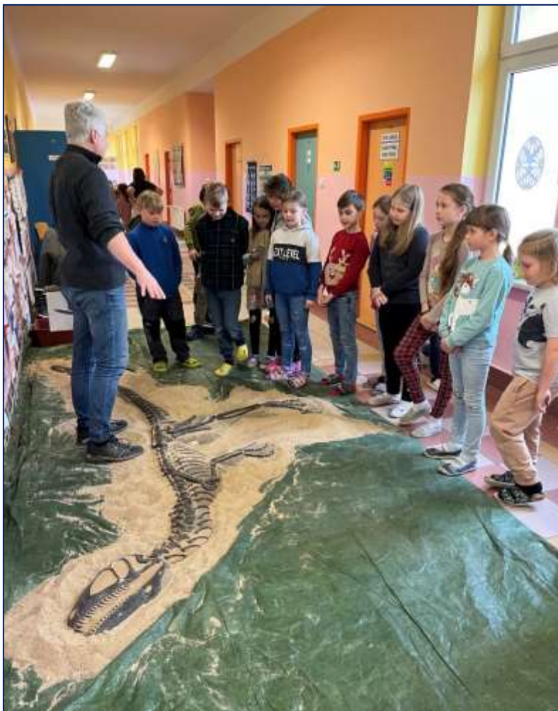
Mobilní trilopark – výukový program

Pedagogové se zaměřovali také na rozvoj zdravého sebevědomí žáků. V každé třídě byl pravidelně zařazován diskusní kruh – všichni žáci měli možnost společně konzultovat záležitosti týkající se jejich třídy, vzájemných vztahů i případných problémů. Žáci také prokázali velkou důvěru ke svým třídním učitelkám.