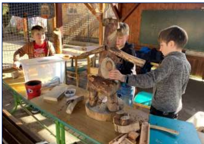
Tvořivá hra na školní zahradě