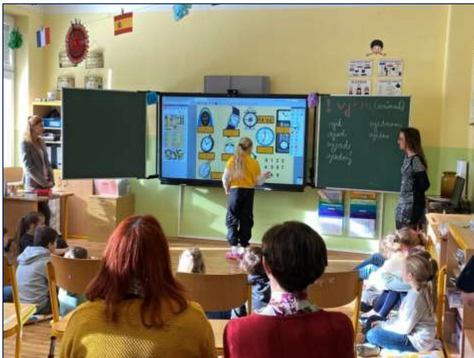
Ukázka práce s interaktivní tabulí