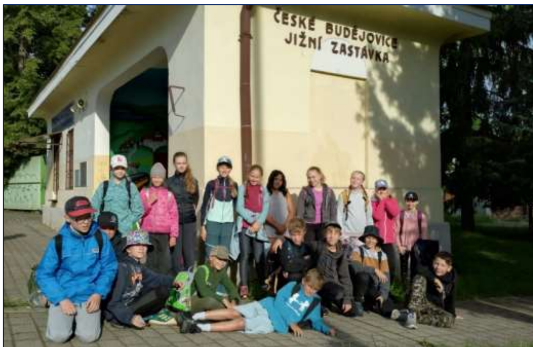
Žáci 5. tříd vyrazili v červnu na Klet'

Ve čtvrté třídě probíhala v průběhu roku práce na zlepšení klimatu třídy (ve spolupráci se Střediskem výchovné péče a Pedagogicko-psychologickou poradnou). Žáci absolvovali společně s etopedy několik programů, což se odrazilo na zlepšení vztahů ve třídě. Žákům prospěly také při zlepšování vzájemných vztahů společné třídní výlety.