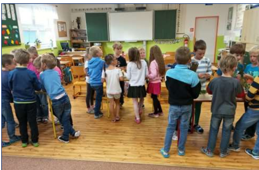
Skupinová výuka v 1. třídě

Ve školním roce 2023/2024 navštěvovalo ZŠ přes 109 žáků 1. – 5. ročníku. Celkově zde bylo šest tříd, z toho byly dvě 5. třídy, v ostatních ročnících (1. až 4.) po jedné třídě.