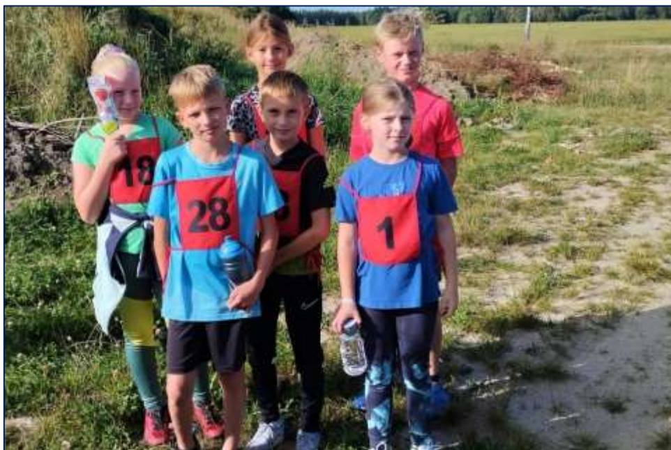
Na Jílovickém pidimaratonu

Ocenění: 1. místo – 1 žák (kategorie 4. tříd) 2. místo – 1 žák (kategorie 5. tříd) 3. místo – 1 žák (kategorie 5. tříd)